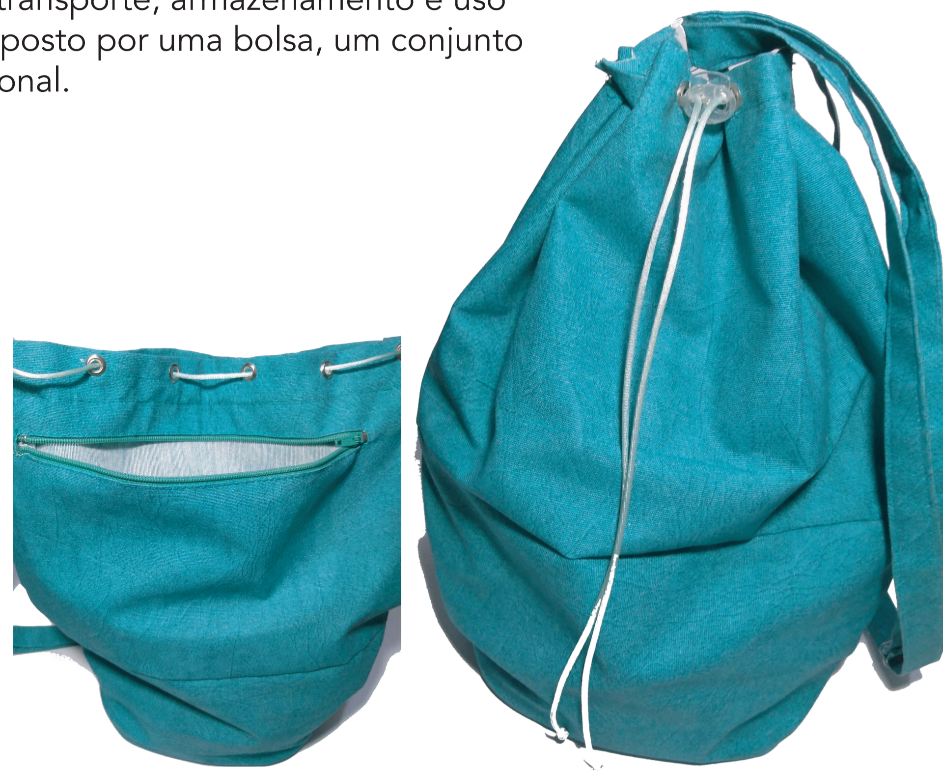
Figura 1 - Bolsa resistente a água.

A bolsa (figura 1) é confeccionada em material resistente a água e organizada com dois compartimentos: 1) bolso interno grande, onde podem ser armazenados o kit de módulos e pertences como roupas e produtos de higiene; 2) bolso com acesso externo fechado com zíper, onde podem ser colocados objetos menores e objetos de valor que não podem ser molhados, permitindo que o usuário mantenha esses pertences sempre ao alcance.