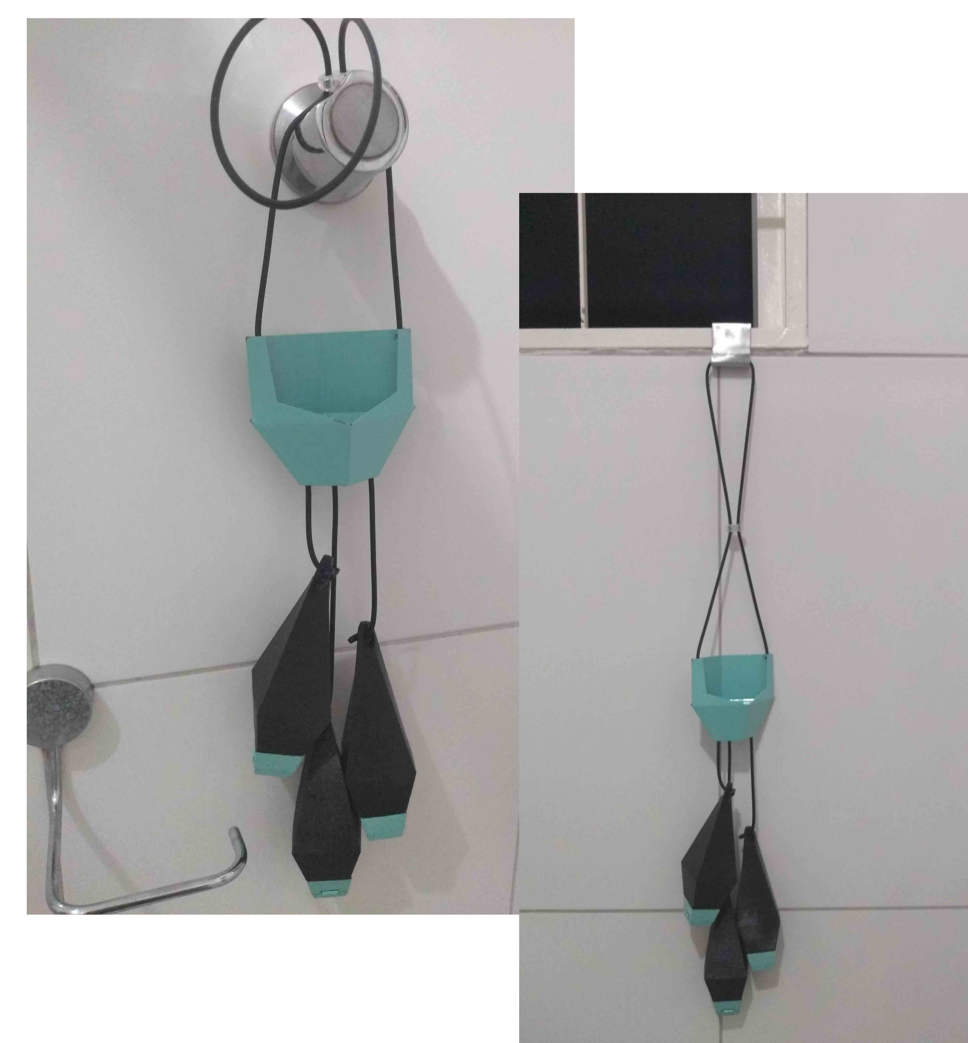
Figura 6 - Formas de fixação.