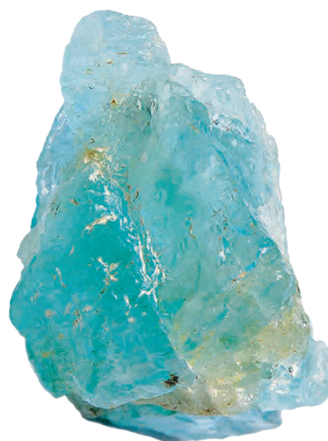
Figura 3 - Cristal Aquamarine.

O logotipo (figura 4) foi criado a partir da silhueta dos módulos do produto, sobrepondo-as de modo a formar uma composição que remete a um conjunto de gotas. Abaixo desta composição apresenta-se o nome do produto, centralizado, na fonte Agency FB (Copyright Font Bureal). As cores são da paleta criada para o produto (Figura 1).